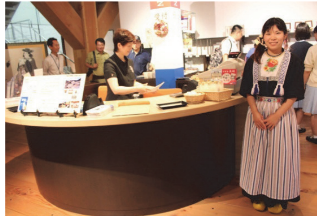
■ 賣店與身著荷蘭傳統服飾的職員

壞與出島商館的遷移等。主要文物：荷蘭東印度公司遣日使節紀行、初代與第3代商館長油畫肖像、南蠻漆器、南蠻甲冑、荷蘭船船首木雕裝飾、大批的日本古文獻與地圖等。另外還設置多媒體空間，播放商館的歷史與復原後的活用，讓觀眾可更為理解商館的發展經緯與復原之重要性。