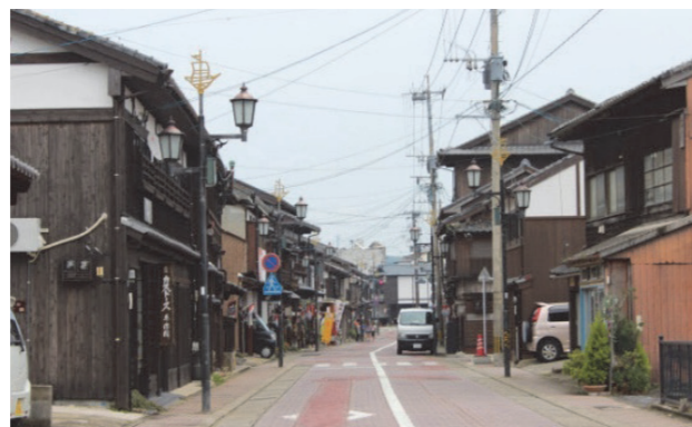
商館鄰近的英國商館街區

荷蘭商館周遭歷史街區方面，早期即執行「平戶—傳統文化都市環境」營造工作，並納入 1990 年代「平戶市綜合都市計畫」，執行傳統街區的整修與鋪面的整備。2000 年代起街區的「木引田町商店街振興組合（公會組織）」開啟「空店鋪空間」的再利用計畫，期待復原英國貿易街區現場，並設置「按針之館」作為社區營造中心。近年更因商館的復原，街區傳統建築配合整體歷史景觀營造，逐步地整修老朽建物與鋪面，讓歷史城區的景觀更為協調一致。