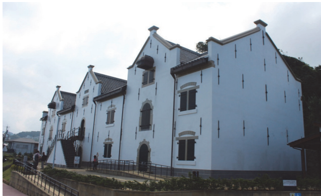
■ 平戶荷蘭商館復原後外觀 (筆者攝於 2015 年 7 月)