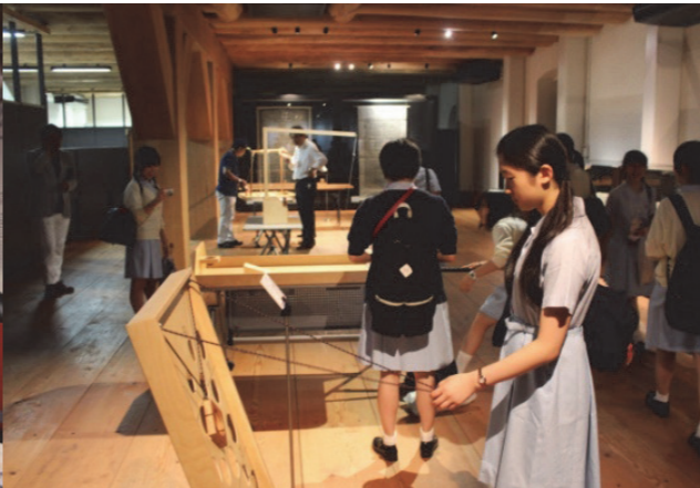
■ 二樓荷蘭傳統遊戲體驗區