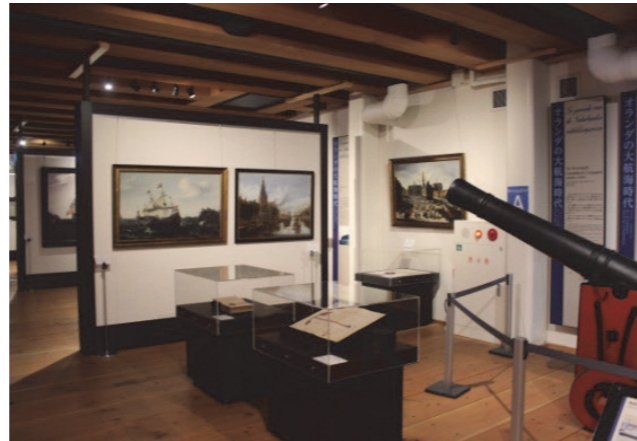
■ 圖書文獻輔以實際文物展示