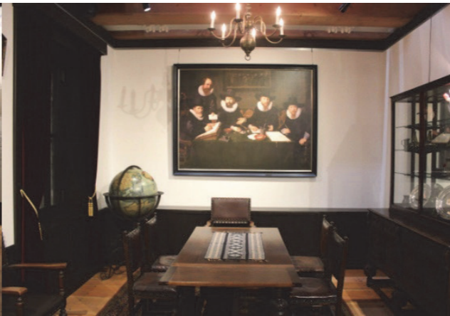
■ 荷蘭生活實際狀態展示