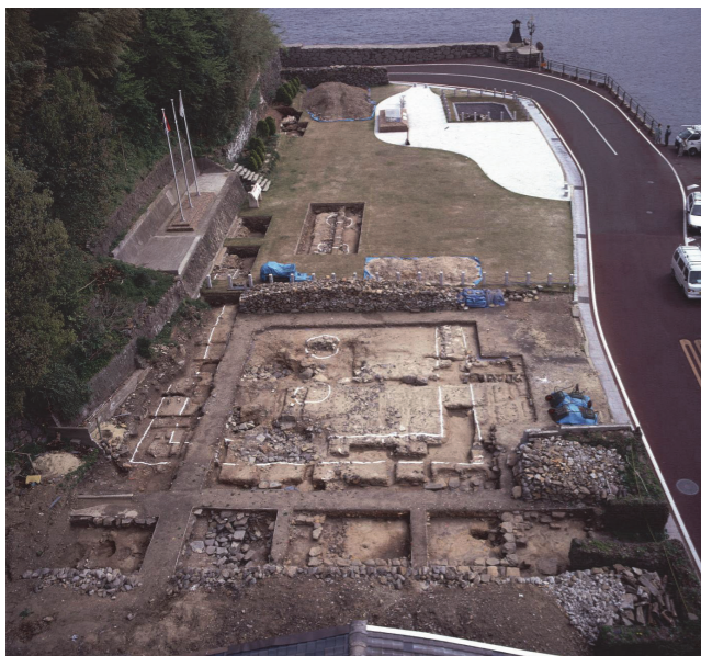
■ 平戶荷蘭商館遺跡挖掘現場

作為日本最早正式與西歐貿易交流的平戶而言，1922 年荷蘭商館遺跡即被指定為「國定史蹟」，1985-1987 年策定保存管理計畫。其後依據保存管理基本方針執行史料與考古挖掘調查，同時檢討整體歷史環境整備計畫，並於 1988 年完成史蹟管理活用方針。(平戶市教育委員會 (a)，2013:3) 長達半世紀的考古挖掘與調查確認，並決定在不破壞現存文資前提下，復原 1639 年所建立的日本第一棟洋式建築「荷蘭商館」，並執行平戶大航海時代歷史的全國的教育宣導與普及化工作。以下將分析平戶如何透過軟硬體資源再造大航海時代歷史現場。