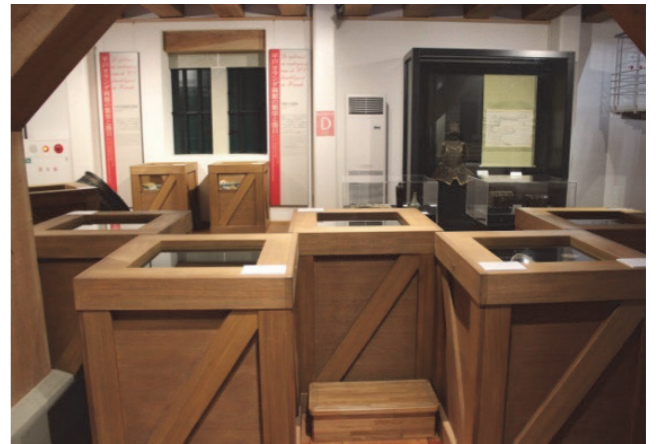
■ 倉庫意象式文物展示