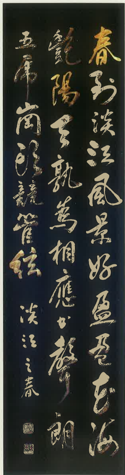
陳衛曾 淡江之春／陳冠甫 春到淡江風景好，盈盈花海艷陽天， 孰為相應書生朗，五虎崗頭競管弦。