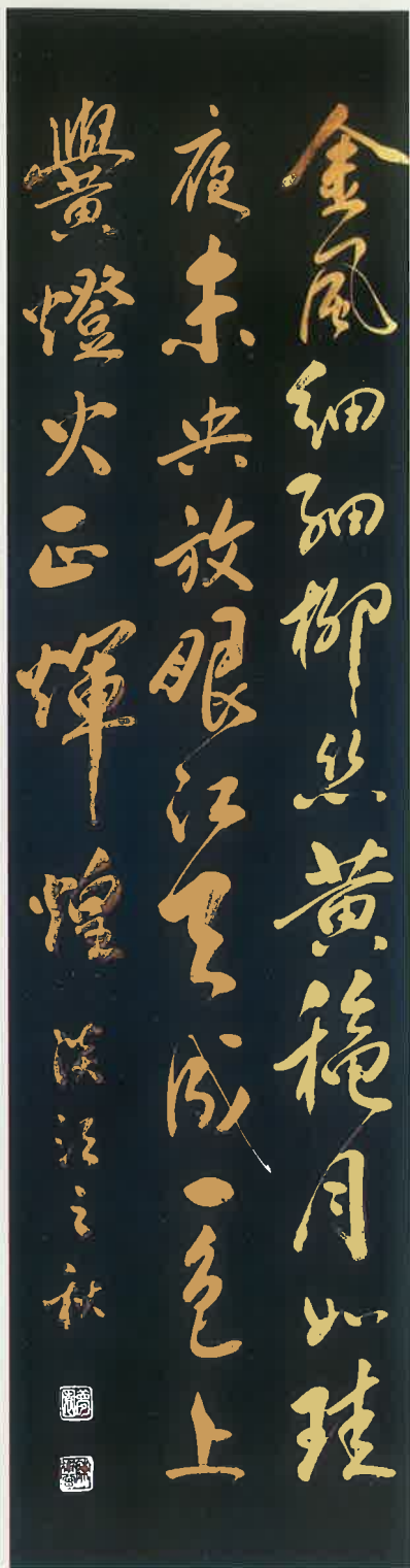
陳衛曾 淡江之秋／陳冠甫 金風細細柳絲黃，秋月如珪夜未央， 放眼江天成一色，上巒燈火正輝煌。