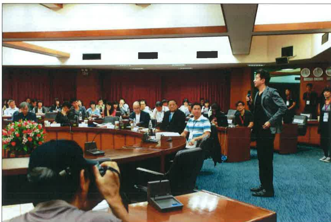
賴怡成系主任致詞