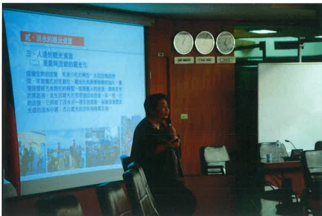
張寶釧前主任秘書發表