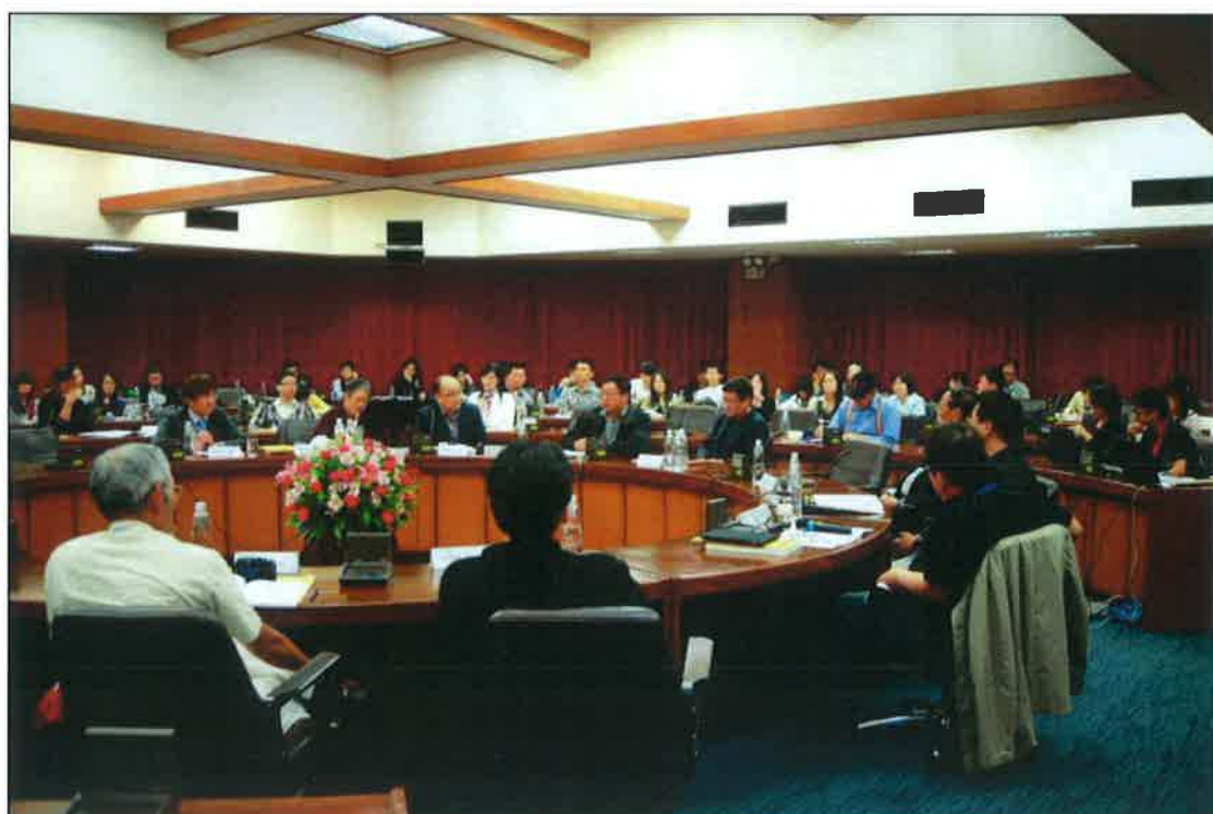
學者、貴賓及與會學員討論