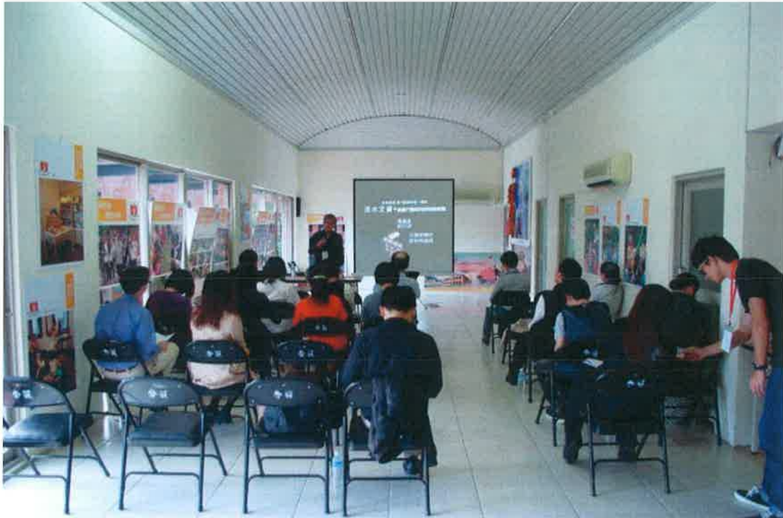
參訪前黃瑞茂教授簡報