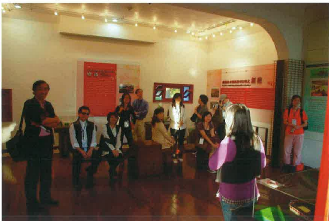
前清淡水關稅務司官邸導覽